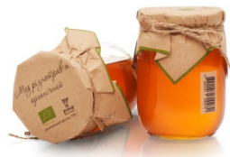
МЕД РІЗНОТРАВ'Я 0,7 КГ