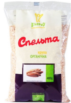
КРУПА ЗІ СПЕЛЬТИ