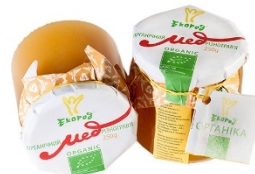
МЕД РІЗНОТРАВ'Я 0,25 КГ