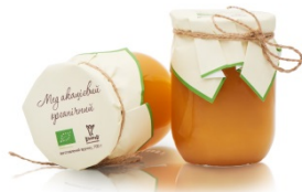
МЕД АКАЦІЯ 0,7 КГ