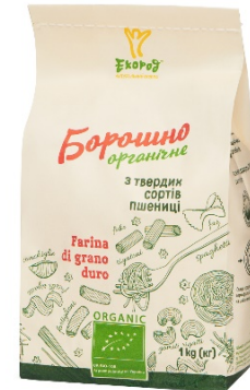
БОРОШНО З ТВЕРДИХ СОРТІВ ПШЕНИЦІ ДУРУМ