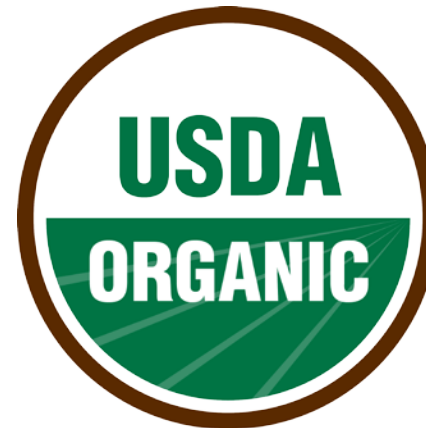
АМЕРИКАНСЬКИЙ ОРГАНІЧНИЙ СТАНДАРТ