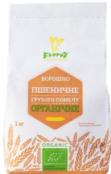
БОРОШНО ПШЕНИЧНЕ ГРУБОГО ПОМЕЛУ