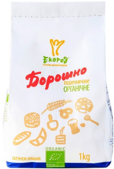
БОРОШНО ПШЕНИЧНЕ ВИЩОГО ГАТУНКУ