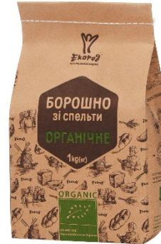
БОРОШНО ЗІ СПЕЛЬТИ