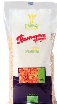
КРУПА ПШЕНИЧНА «АРНАУТ»